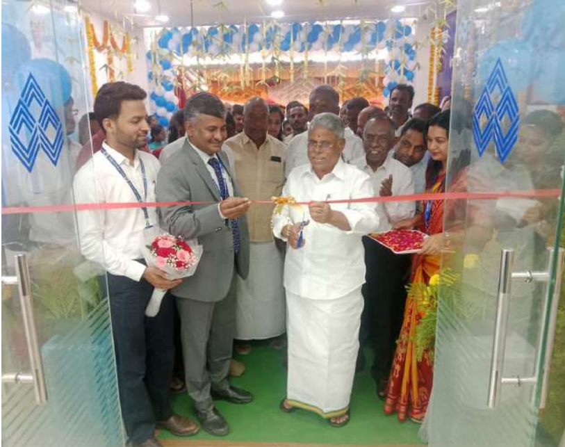
ப ல் ர யி ர க் க ன க் க ா ன தொடர்ந்துமகளிர் சுயஉதவி குழுவினர் வாடிக்கையாளர்கள் உருவாக தனது மற்றும் விவசாயிகளுக்கு கடன் உதவித்தொகை வழங்கப்பட்டது.

வாடிக்கையாளர்கள் வாங்கிய கடனை நானையாக திருப்பி செலுத்தினால் பொதுமக்களுக்கு தானாக முன் வந்து எத்தனை கோடி வேண்டுமானாலும் இந்தியன் ஓவர்சீஸ் வங்கி கடன் உதவி அளிக்கும் என தெரிவித்தார். மேலும் வங்கியில்